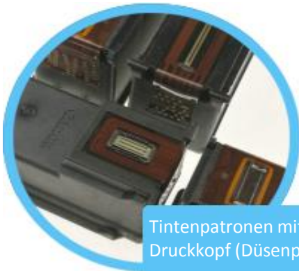
Tintenpatronen mit Druckkopf (Düsenplatte)