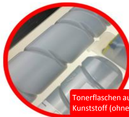
Tonerflaschen aus Kunststoff (ohne Metall)

An Tonerkartuschen befinden sich in der Regel viele Metallteile, wie Magnetwalzen oder Photoleitereinheiten. Hier macht die Wiederverwendung Sinn. Ganz anders bei Tonerflaschen, also Kunststoffbehältern mit Tonerpulver. Wir kaufen und entsorgen keine Tonerflaschen.