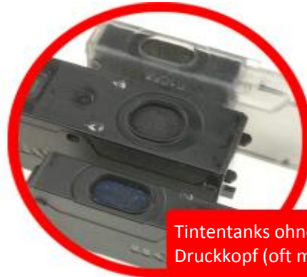
Tintentanks ohne Druckkopf (oft mit Chip)

Tintenpatronen mit Druckkopf bestehen aus vielen hochwertigen Rohstoffen, so dass sich die Wiederverwendung rechnet. Ganz im Gegenteil zu Tintentanks, also Tintenpatronen ohne Druckkopf. Tintentanks ohne Druckkopf werden von uns weder angekauft noch entsorgt.